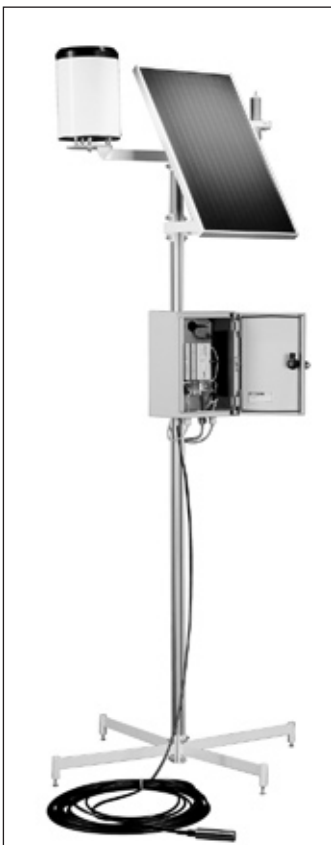
Ortsunabhängig durch den Einsatz solarer Stromerzeugung, ist das Monitoringsystem innerhalb kurzer Zeit einsatzbereit.

Die kundenspezifischen Anpassungen in der Auswertung erfolgen durch firmeneigene Softwarespezialisten. Auf Wunsch übernimmt der Hersteller auch den Einbau