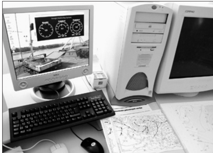
Der Zugriff auf die aktuellen Messwerte sowie auf das Datenarchiv ist jederzeit über das Internet passwortgeschützt möglich

Ursprünglich gewissenhaft geplant, sind sie über die Jahre hinweg mit mehr oder weniger stark belastetem Wasser beschickt worden. Das stößt jedoch häufig auf Schwierigkeiten, weil die ursprünglich für den Einsatzort angenommenen ortsspezifischen Rahmenbedingungen nicht mehr zutreffend sind. Die Enregis GmbH, Arnberg, spezialisiert auf die Herstellung und den Vertrieb von Versickerungssystemen, löst dieses Problem