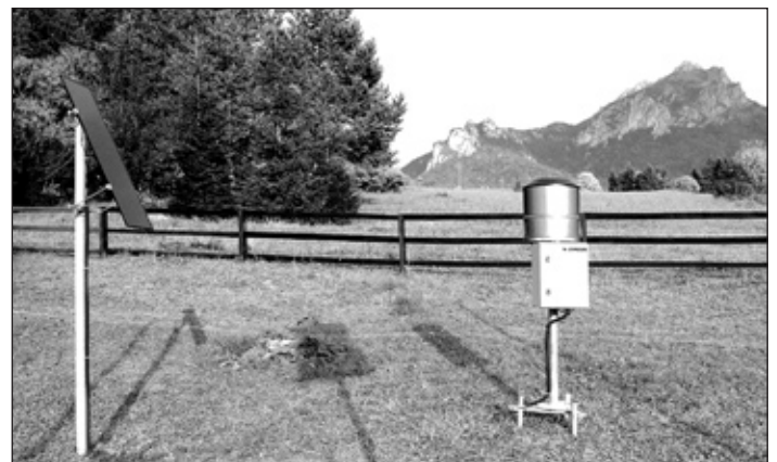
Enregis/Protect in Frankreich